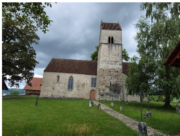
Historische romanisch/gotische Kirche Kirchbühl

Nachdem sich die dunkeln Wolken verzogen und sich nicht entleert hatten, nahmen wir den Schlussteil unter die Füsse. Über hohe Stufen stiegen wir den kurzen Abschnitt des Mühltales Richtung Sempach hinunter.