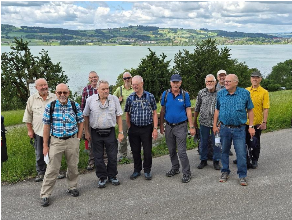
Auf der Via Gottardo

Auf dem Römerweg marschierten wir durch die Rebberge der Brunner-Weinmanufaktur mit Blick in die Zentralschweizer Alpen. Bald erblickten wir das historische Städtchen Sempach und weiter westlich Sempach-Station. Da auf dem Picknick-Platz kein Holz zur Verfügung stand, machte der Wanderleiter einen Aufruf an die Teilnehmenden, auch ein Schiitli mitzunehmen. Und so konnten oberhalb des Mühltales ein prächtiges Feuer entfachen. Umso herrlicher mundeten die mitgebrachten Würste.